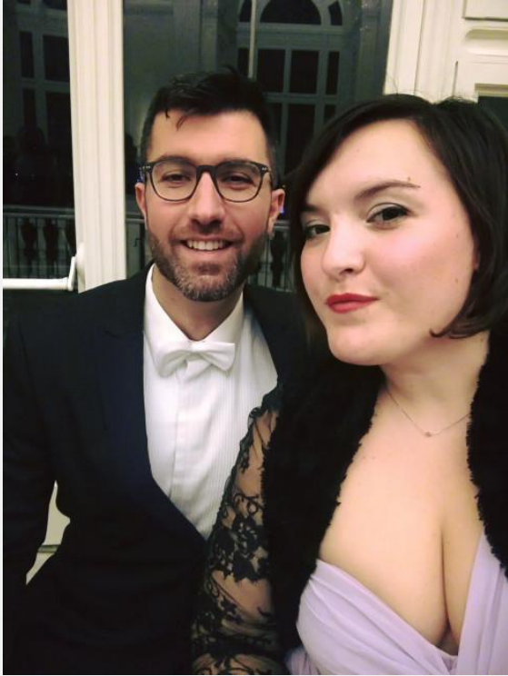
Gran Ballo delle Debuttanti, Reggia di Venaria ( e noi c'eravamo!)

Forse un eccesso di lustrini, galateo e formalità, molto lontano dalla società moderna, ma se per una sera ci si vuole sentire una principessa, che male c'è?