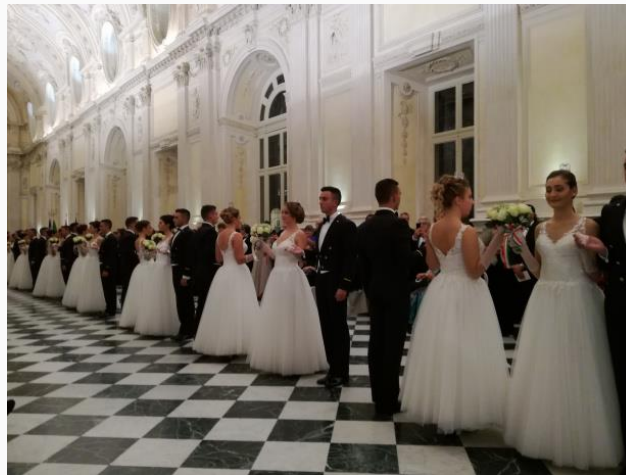
Gran Ballo delle Debuttanti, Reggia di Venaria

Un po' gattopardo e un po' Elisa di Rivombrosa, quelle raffinatezze e quelle galanterie che vediamo sempre più spesso nei film e sempre meno nella realtà, almeno per una notte prendono vita, animando la Reggia di Venaria e incantando i suoi ospiti. L'evento, organizzato per la XXIII Edizione grazie a Vienna sul Lago ha permesso l'incontro di 30 coppie che per mano e con lo sguardo hanno danzato nella meravigliosa Galleria Grande con il pavimento a scacchi. Le giovanissime debuttanti, con un'età compresa tra i 17 e i 24 anni avvolte da un morbido vestito di tulle bianco disegnato da Carlo Pignatelli e con un piccolo bouquet di rose bianche in mano strette da una coccarda, hanno percorso la navata della galleria in tutta la sua lunghezza al fianco degli Allievi Ufficiali dell'Accademia Navale di Livorno. Emozionatissime e con la coroncina in testa le prime, integerrimi e seri i secondi.